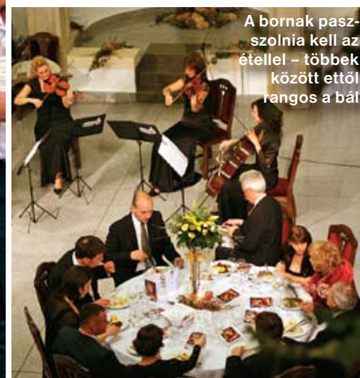
A bornak paszszolnia kell az étellel – többek között ettől rangos a bál