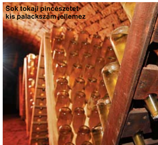
Sok tokaji pincészetet kis palackszám jellemez

- Igen, a borászok egymást segítik, nem féltékenykednek, legalábbis nem komolyan, mert hiába bosszankodnának, hogy a másik többet ad el, a közös érdek mégiscsak