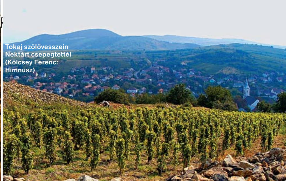
Tokaj szőlővesszein Nektárt csepegtetted (Kölcsey Ferenc: Himnusz)